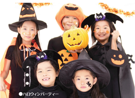
● ハロウィンパーティー